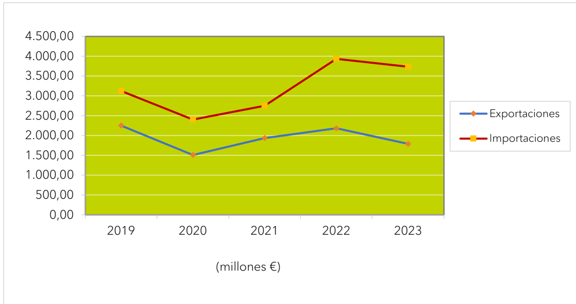
Gráfico 2. Evolución exportaciones Murcia-Corea del Sur. 2019-2023