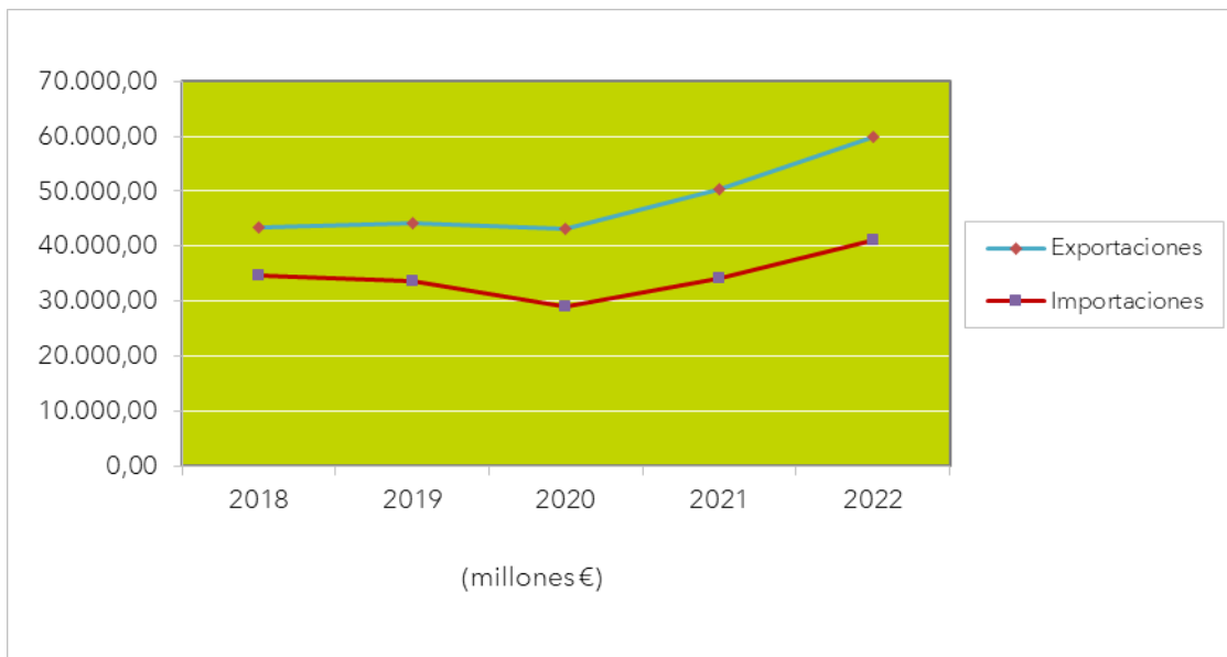
Gráfico 2. Evolución exportaciones Murcia-Francia. 2018-2022