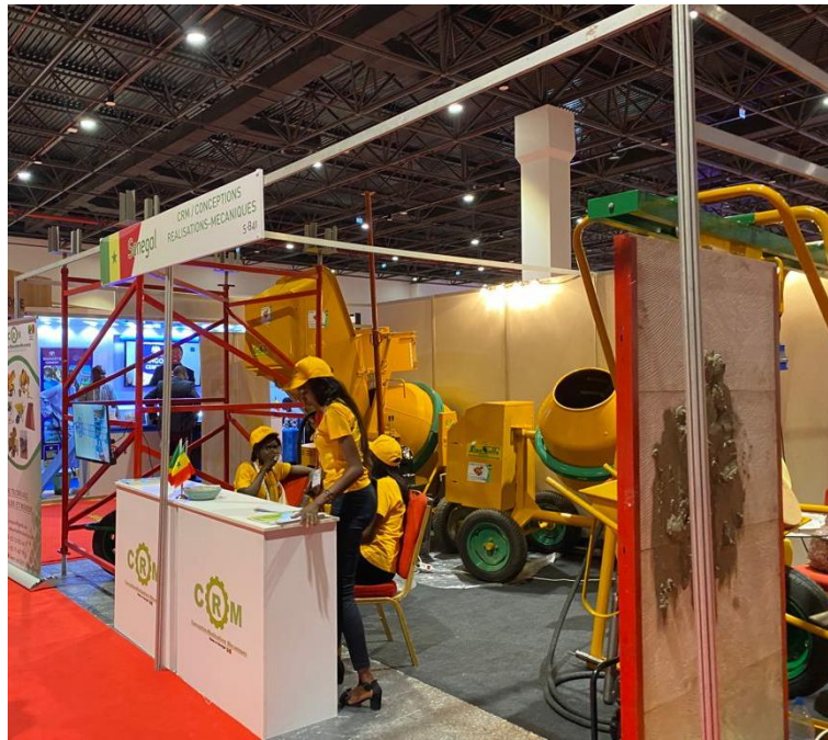
Empresas expositoras en la feria.

El perfil de los participantes se centró en gerentes inmobiliarios, servicios industriales y de consultoría, arquitectos y diseñadores, e ingenieros y técnicos desarrolladores.