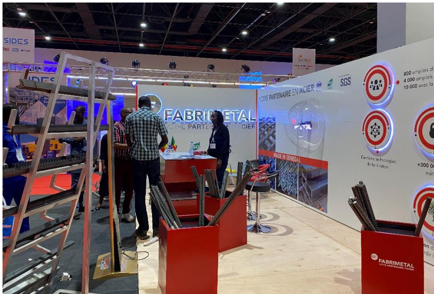
Empresas expositoras en la feria

El perfil de los participantes se centró en gerentes inmobiliarios, servicios industriales y de consultoría, arquitectos y diseñadores, e ingenieros y técnicos desarrolladores.