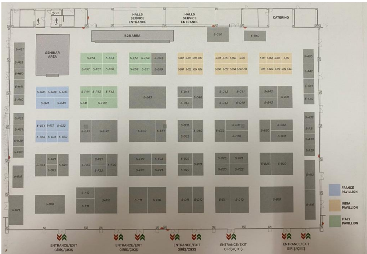
Plano de distribución de los stands.