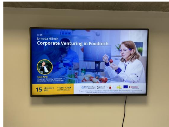
*Ejemplo de pantallas