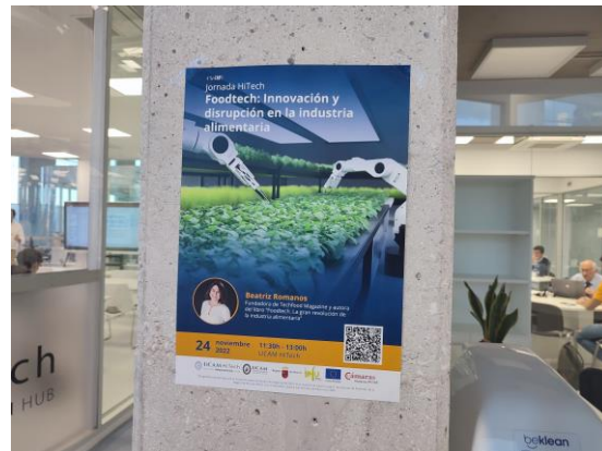
*Ejemplos de carteles ubicados en UCAM HiTech